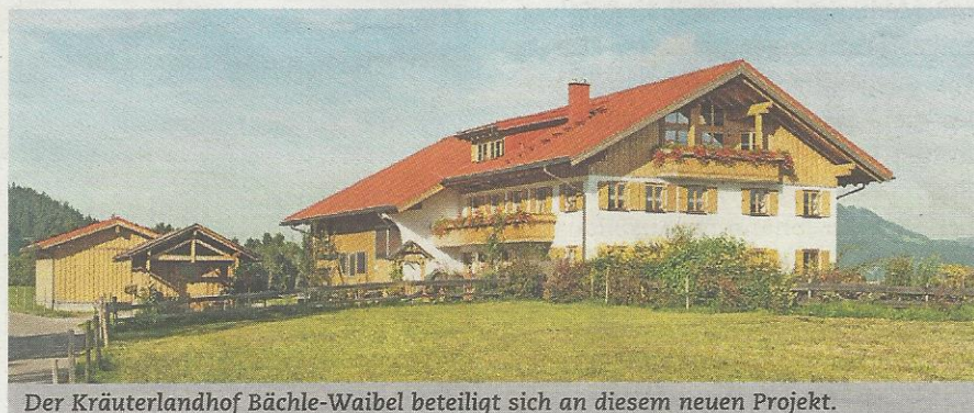
Der Kräuterlandhof Bächle-Waibel beteiligt sich an diesem neuen Projekt.

– da locken entspannende Abenteuer. Oder die Gäste haben Lust zu basteln, z.B. Moos- und Heuherzen, mit Moorlauge zu malen oder ein Herbarium anzulegen. Mit den selbst gemachten Kräuterprodukten wie Kräutersalz, Tees oder Fruchtaufstrichen ist auch das kulinarische Verwöhnprogramm garantiert.