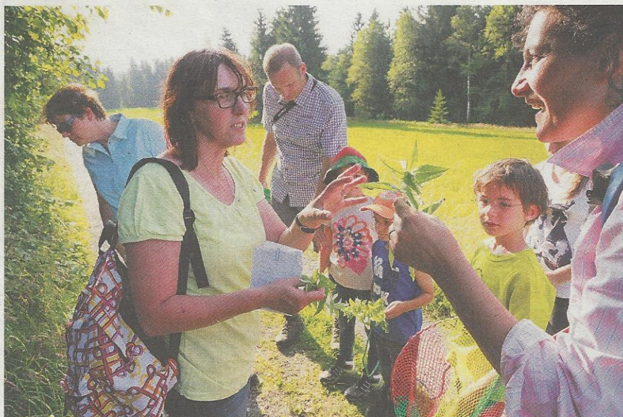
In Ofterschwang werden auch begleitete Moorwanderungen angeboten.

Z ehn „Urlaub auf dem Bauernhof“-Betriebe bieten ab diesem Herbst als „Allgäuer eMOORTionen-Höfe“ Moorlebnis-Urlaub auf dem Bauernhof an. Die Landwirte und Landwirtinnen sind nun dafür geschult, das Thema Moor auf ihren Bauernhöfen zum Erlebnis zu machen. Die Gäste der Allgäuer eMOORTionen-Höfe dürfen sich von den vielfältigen Angeboten überraschen lassen und in die mystische Welt der Moore eintauchen. Im Sommer draußen mit Mooressenz